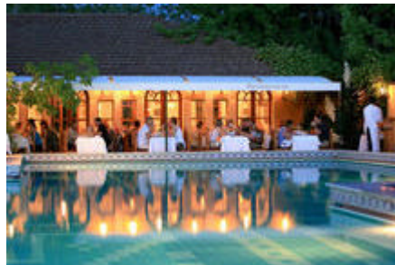
Entspanntes Dinner am Wasser

Troja, an der Einmündung der Dardanellen gelegen, ist der eine historische Höhepunkt an der sogenannten Olivenriviera, die zur türkischen Ägäis gehört. Die antike Weltstadt Pergamon – das heutige Bergama – der andere. Ungefähr auf halbem Weg dazwischen liegt der Ferienort Ören. In der Antike hieß er Adramyttion. Dort gründete der Apostel Paulus eine christliche Gemeinde.